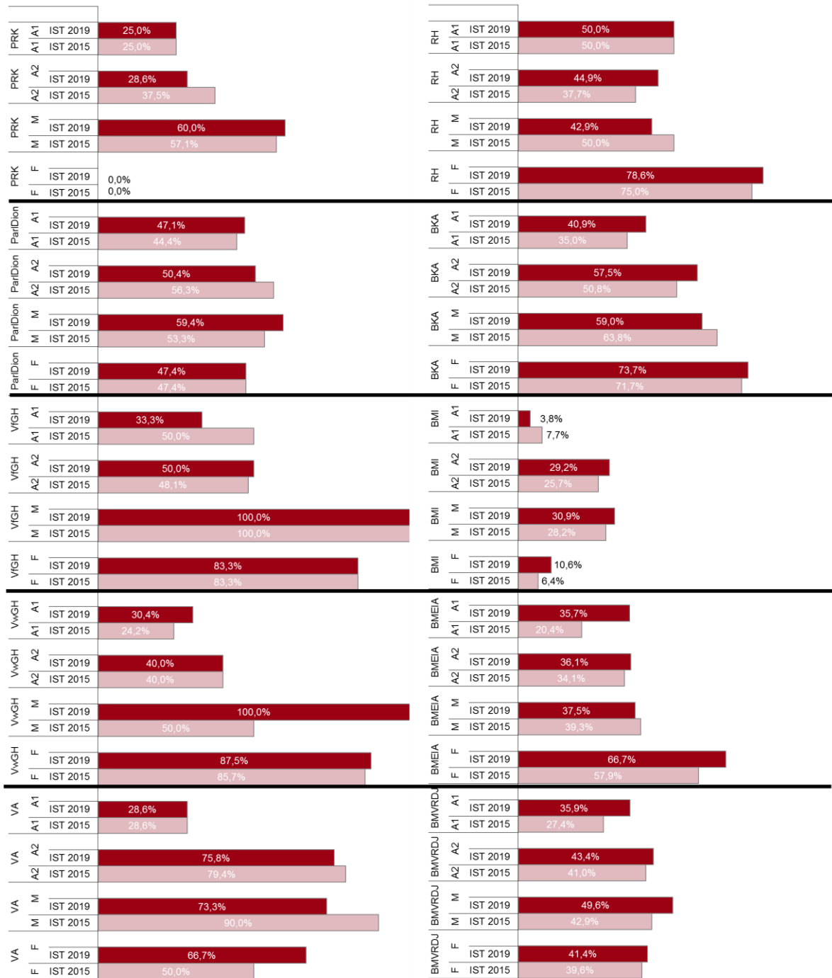
Abbildung 1 Frauenanteile in den höchsten besoldungsrechtlichen Einstufungen, Ist-Stand 2015 im Vergleich zum Ist-Stand 2019