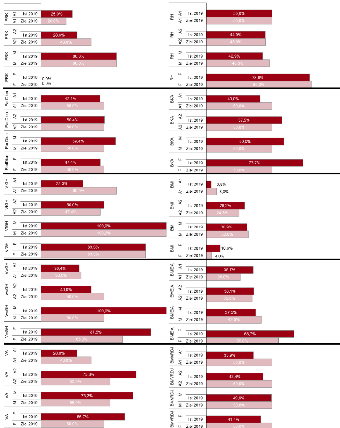
Abbildung 3 Frauenanteile in den höchsten besoldungsrechtlichen Einstufungen, Ist-Stand 2019 im Vergleich zum Ziel 2019